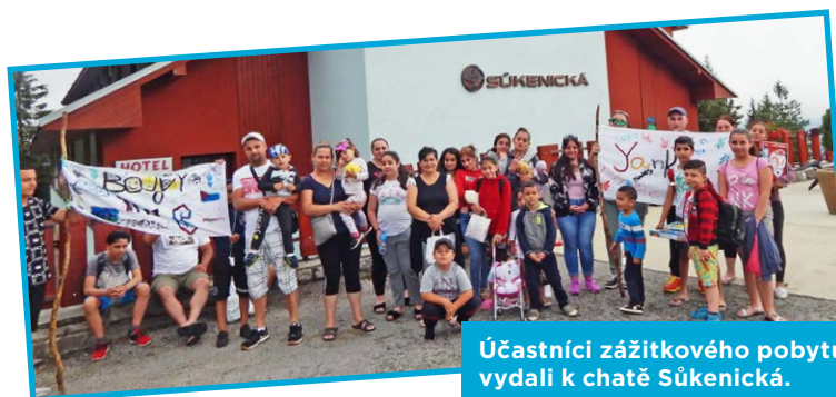
Účastníci zážitkového pobytu se vydali k chatě Sůkenická.