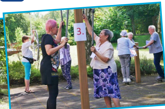
Zkouška cvičebních strojů seniorského hřiště.